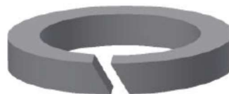
Rysunek 3. Pierścień pakunku trzpienia.