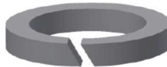
Rysunek 3. Pierścień pakunku trzpienia.