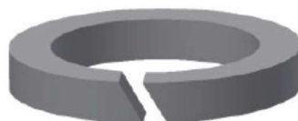
Rysunek 3. Pierścień pakunku trzpienia.